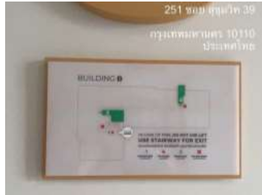
รูปที่ 23 ป้ายแสดงตำแหน่งที่ตั้งอุปกรณ์ป้องกันอัคคีภัย