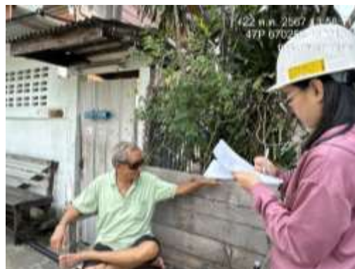
รูปที่ 1 เจ้าหน้าที่โครงการเข้าพบบ้านพักอาศัยข้างเคียง