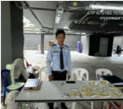
รูปที่ 11 เจ้าหน้าที่รักษาความปลอดภัย