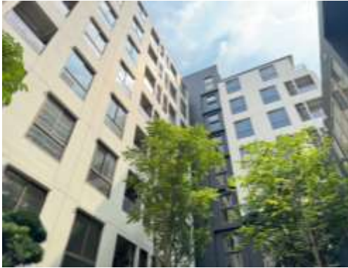
รูปที่ 5 ภาพถ่ายโครงการ ณ ปัจจุบัน