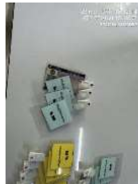
รูปที่ 27 บัตรผ่านชั่วคราวสำหรับบุคคลภายนอก