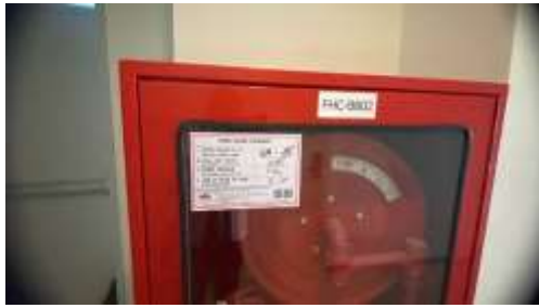
รูปที่ 22 การตรวจสอบระบบป้องกันอัคคีภัย