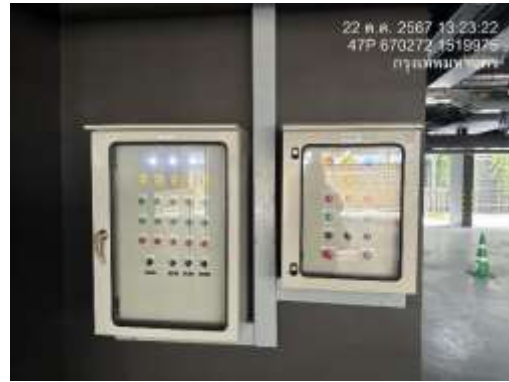
รูปที่ 8 ตรวจสอบตู้ไฟฟ้า