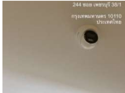
รูปที่ 29 กล้องวงจร