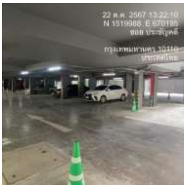
รูปที่ 13 พื้นที่สำหรับจอดรถจักรยานยนต์