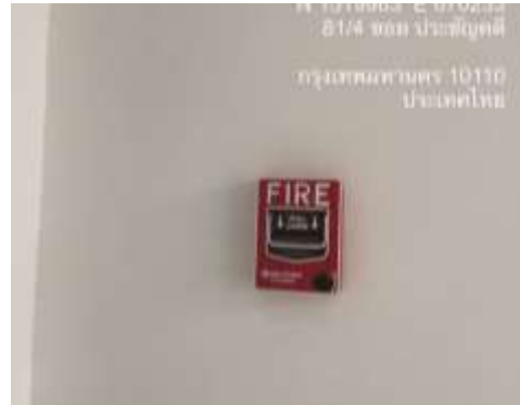
รูปที่ 17 อุปกรณ์เตือนภัยและป้องกันอัคคีภัยของโครงการ (ต่อ)