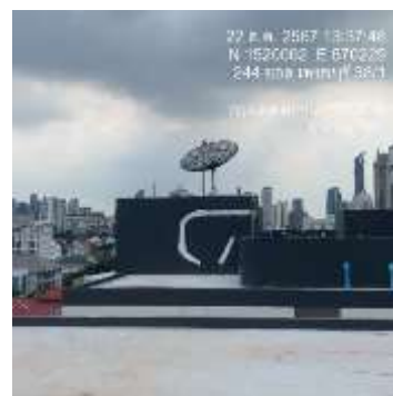
รูปที่ 15 ถังสำรองน้ำใช้