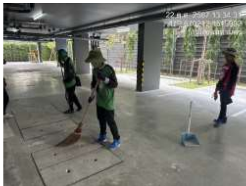
รูปที่ 30 เจ้าหน้าที่ทำความสะอาดโครงการ