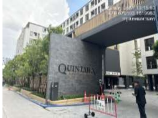
รูปที่ 6 ทางเข้าโครงการ