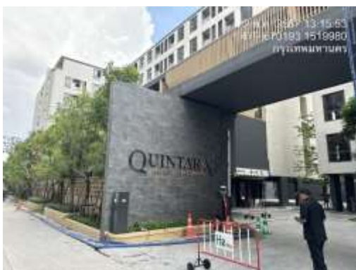
รูปที่ 2 ป้ายรายละเอียดโครงการ