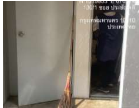
รูปที่ 12 ห้องพัสดุโดยรวม