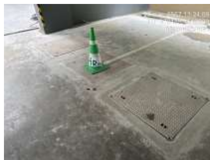
รูปที่ 3 ระบบบำบัดน้ำเสีย