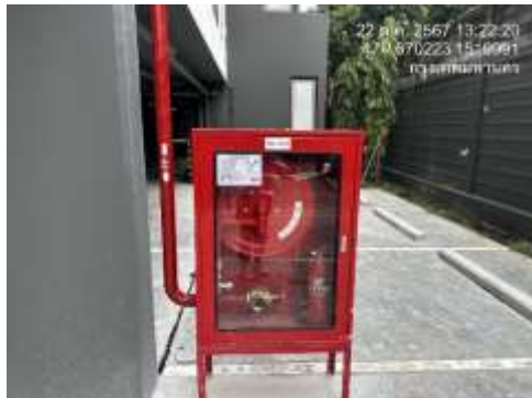
รูปที่ 9 ตรวจสอบถังดับเพลิง