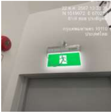
รูปที่ 7 ป้ายทางฉุกเฉิน