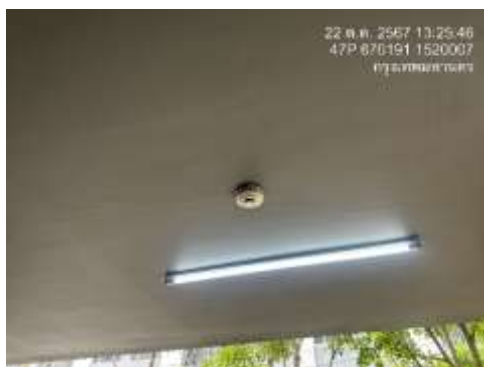
รูปที่ 14 ไฟส่องสว่างบริเวณอาคารจอดรถ