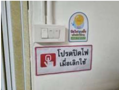
รูปที่ 16 ป้ายประหยัสน้ำ/ประหยัดไฟ