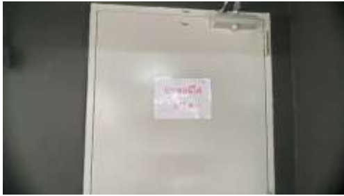
รูปที่ 28 บันไดหนีไฟ