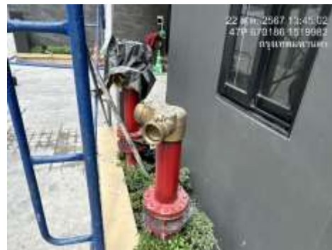
รูปที่ 17 อุปกรณ์เตือนภัยและป้องกันอัคคีภัยของโครงการ (ต่อ)