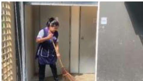
รูปที่ 26 เจ้าหน้าที่รักษาทำความสะอาดห้องขยะ